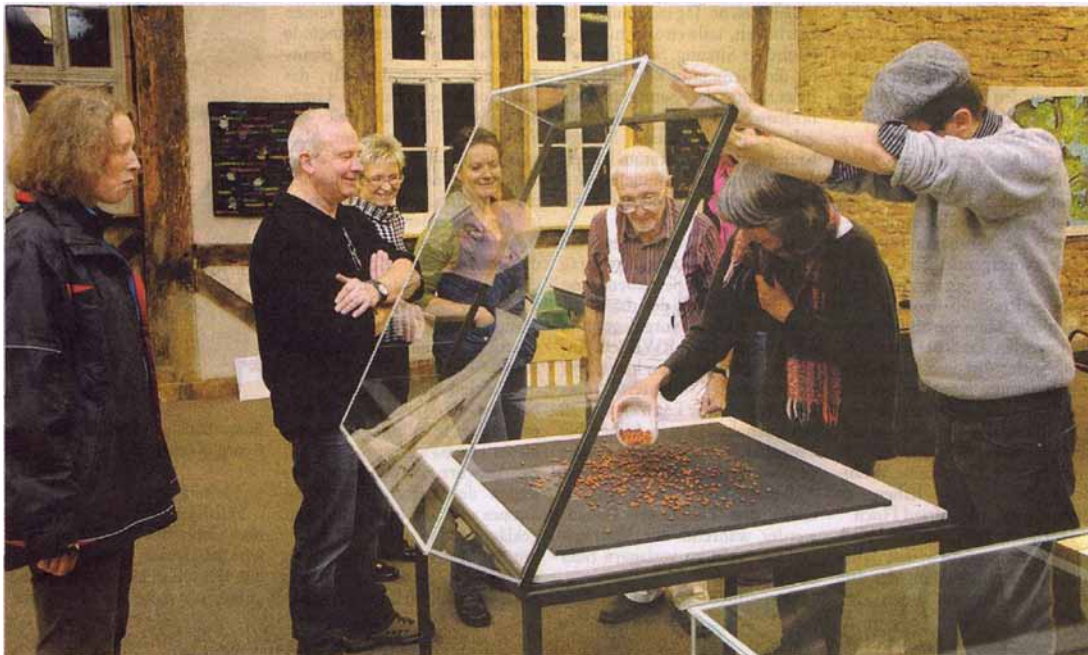
Es werde Kunst: Die Künstler des Kunstkreises Holzminden haben beim Hängen, Stellen und Ausrichten viel Spaß.